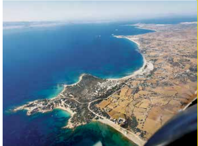
Endlose Strände Die Inselwelt der Kykladen ist aus der Luft ebenso beeindruckend wie am Boden. Auf dieser Reise lässt sich beides erleben