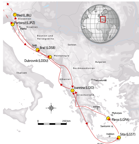
KARTE: DEINZER GRAFIK