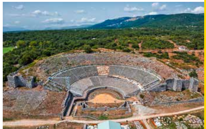
Antike Unterhaltung Das griechische Theater von Dodoni was eines der größten seiner Zeit